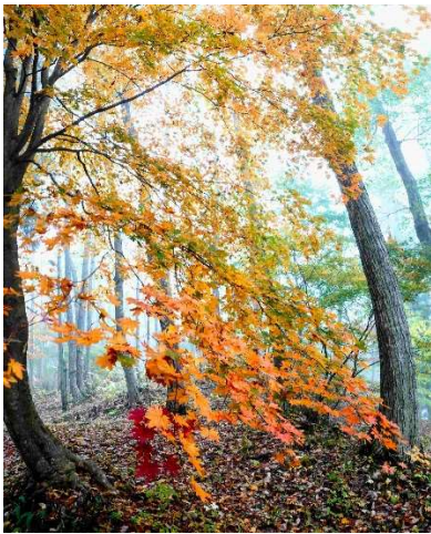
m DSC_3929 コハウチワカエデ黄葉 R05.11.04AM0715 S.jpg