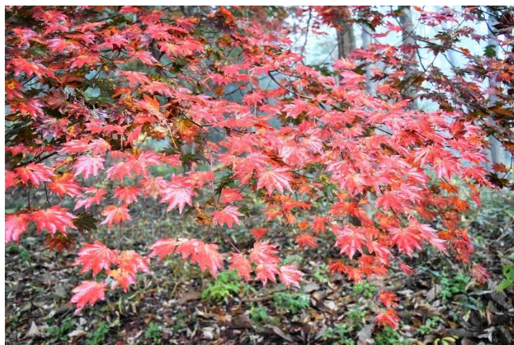
m DSC_4682 コハウチワカエデ紅葉 R05.11.04AM0729 N.jpg