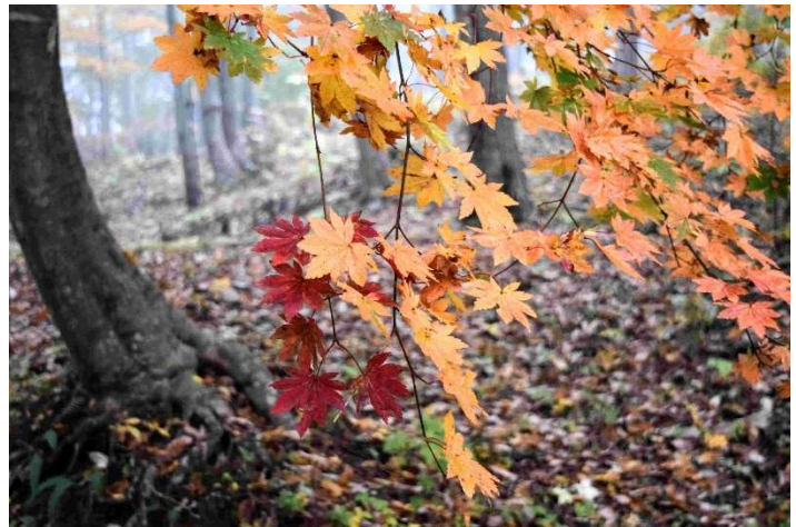
m DSC_4669 コハウチワカエデ黄葉 R05.11.04AM0714 N.jpg