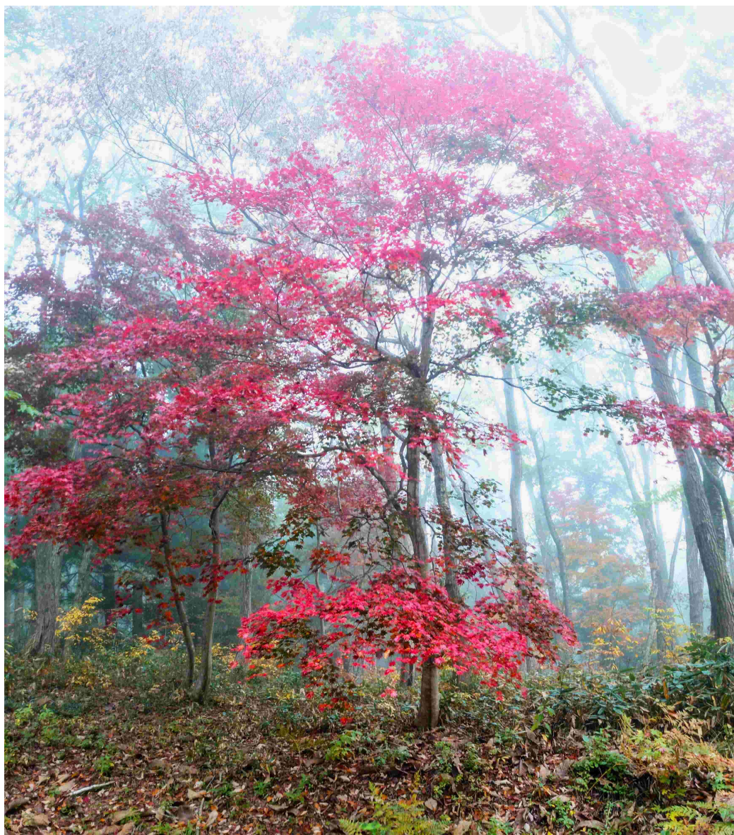
m DSC_3936 コハウチワカエデ紅葉 R05.11.04AM0729 S.jpg