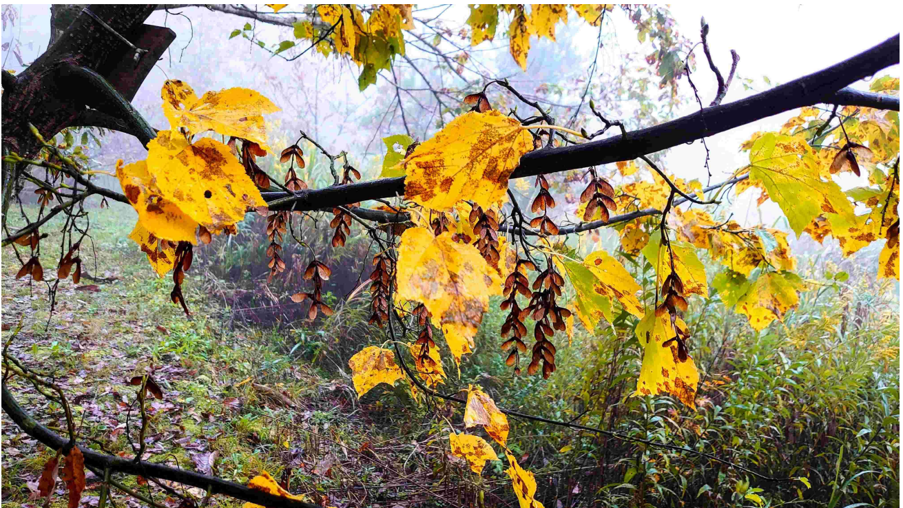
m DSC_3934 ウリハダカエデ黄葉 R05.11.04AM0725 S.jpg